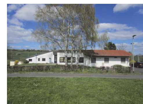
Haupteingang im Norden